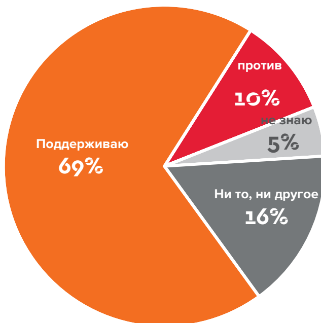
Рисунок 1: Вопрос «В какой степени, если вообще в какой-то, вы поддержали бы или были бы против повышения налогов на богатых и на крупные корпорации для финансирования таких областей, как образование, профессиональная подготовка и здравоохранение?» Шкала ответов: Решительно поддерживаю; скорее, поддерживаю («ПОДДЕРЖИВАЮ»), ни «за», ни «против» (НИ ТО, НИ ДРУГОЕ), скорее, против; решительно против («ПРОТИВ»), не знаю (НЕ ЗНАЮ) N=12,242.

В какой степени, если вообще в какой-то, вы поддержали бы или были бы против повышения налогов на богатых и на крупные корпорации для финансирования таких областей, как образование, профессиональное обучение и здравоохранение?