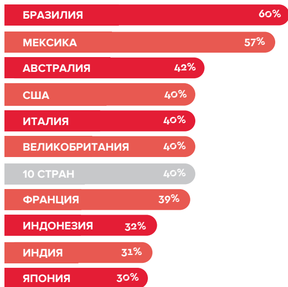
Рисунок 2: Вопрос «Для каждой из следующих профессий, считаете ли вы, что вероятность столкнуться с насилием и домогательствами выше для мужчин или женщин или что она для них одинакова?». Отображены только ответы «Вероятность столкнуться с насилием и домогательствами выше для женщин». N=12242 (Австралия n=1056, Бразилия n=1008, Франция n=1037, Великобритания n=1674, Индия n=1012, Индонезия n=2131, Италия n=1067, Япония n=1000, Мексика n=1000, США n=127)