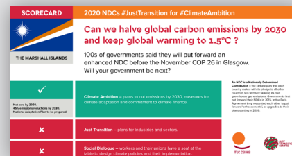
Tabla de puntuaciones sobre CDN