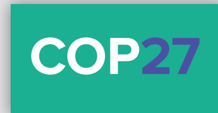
Conferencia de la ONU sobre el Cambio Climático

LA TRANSICIÓN JUSTA ES LA VÍA HACIA UNA MAYOR AMBICIÓN – TRABAJOS DECENTES EN UN PLANETA VIVO