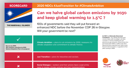
Tabla de puntuaciones sobre CDN