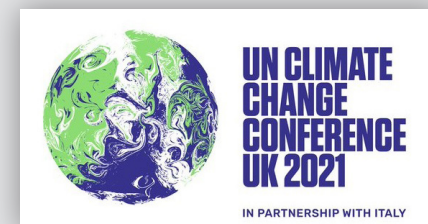
Conferencia de la ONU sobre el Cambio Climático

LA TRANSICIÓN JUSTA ES LA VÍA HACIA UNA MAYOR AMBICIÓN – TRABAJOS DECENTES EN UN PLANETA VIVO