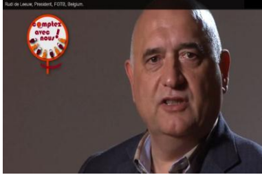
Rudi de Leeuw, Präsident, FGTB, Belgien (Fr) http://www.ituc-csi.org/count-us-in-campaign-interview-14357