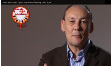
Javier de Vicente Tejada, Internationaler Sekretär, USO, Spanien http://www.ituc-csi.org/count-us-in-campaign-interview-14346