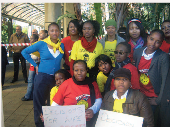
Equipo de Decisiones para una Vida apoyando la huelga en la SABC.

E l servicio de estudios laborales Labour Research Service (LRS) coordina la campaña con las cuatro centrales sindicales afiliadas a la CSI y tres afiliadas de UNI. Esta coalición se ampliaría más tarde al formarse redes con ONG y grupos culturales, extendiendo el alcance de la campaña.