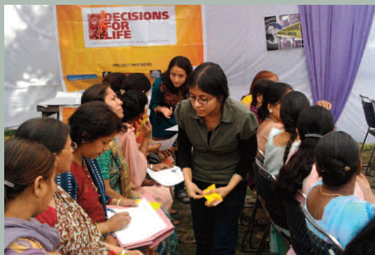
Evento con ocasión del Día Internacional de la Mujer en la India.

Entre el lanzamiento y el evento organizado en junio de 2010 con ocasión del Día Internacional de la Lucha contra el Uso Indevido y el Tráfico Ilícito de Drogas, se consiguió atraer nada menos que a 1.109 mujeres participantes en sus actividades.