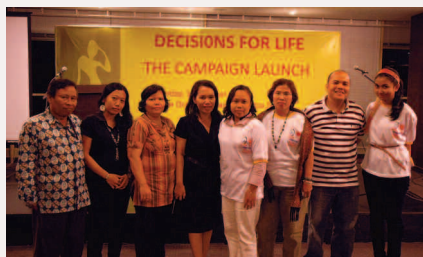
Lanzamiento de la campaña en Indonesia.

Hasta la fecha han encontrado que mantener contactos informales, cara a cara, funciona mejor para ganarse la confianza de las mujeres. El equipo de KSBSI intenta llegar a las mujeres jóvenes recurriendo a las herramientas de comunicaciones que éstas más utilizan, como Facebook y Twitter. No sólo han mejorado las comunicaciones y han llegado a una amplia audiencia, sino que además han mejorado la imagen del sindicato, que ahora se considera una organización para trabajadores jóvenes.