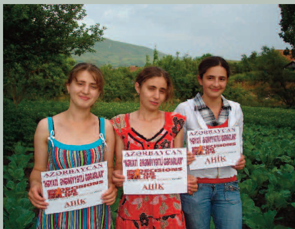
Mujeres en una actividad de la campaña Decisiones para una Vida.

A HIK, en cooperación con Khidmat-Ish, una afiliada de UNI/UITA, ha involucrado con éxito a mujeres de Azerbaiyán en su campaña sobre modelos a seguir, contando su vida en sesiones para inspirar a mujeres más jóvenes. Se emplearon técnicas teatrales durante las actividades del 8 de marzo, dedicadas en 2010 a Decisiones para una Vida. El evento del 8 de marzo recibió amplia cobertura en los medios de comunicación y la producción teatral atrajo a 360 mujeres participantes. AHIK ha publicado además un libro sobre “Derechos de los trabajadores/as jóvenes”, que cubre los convenios internacionales, la Carta Social Europea, el código laboral de Azerbaiyán y otras leyes nacionales. La membresía sindical ha venido aumentando de forma continua desde el inicio de la campaña, particularmente entre las vendedoras ambulantes y trabajadoras en telecomunicaciones.