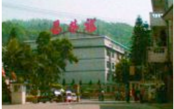
Die Taschenfabrik befindet sich im Stadtbezirk Longgang, Shenzhen

YWCs Produktionsstätte in Shenzhen ist sehr groß und umfasst fünf Fabrikgebäude (Blöcke K, A, B, C und D mit insgesamt etwa 3.000 Fertigungsmaschinen), ein 3-stöckiges Wohnheim, Kantinen, eine Klinik, Freizeitanlagen (eine Bücherei, ein Basketballfeld und einen Billardtisch) und mehrere kleine Läden.