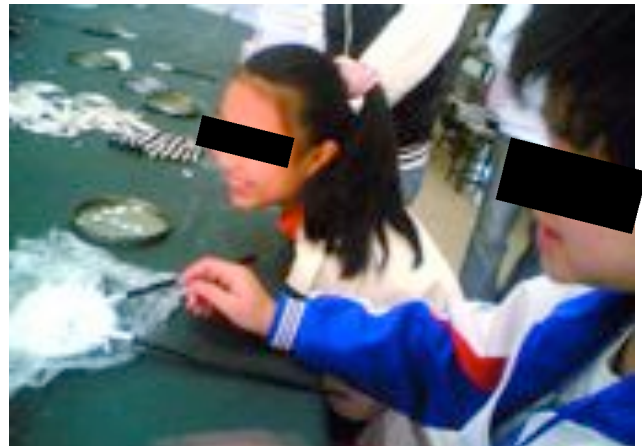
Schüler aus Grund- und weiterführenden Schulen, die in den Schulferien bei Lekit angestellt waren (ein Nachforscher von Play Fair arbeitete im Januar 2007 mit ihnen zusammen).

Lekit Stationery Co., Ltd. , gegründet 1977, ist ein nach ISO 9001 zertifizierter Hersteller von Papier- und Lederprodukten. Play Fair stellte seine Nachforschungen in einer der Produktionsstätten des Unternehmens in Dongguan in der Provinz Guangdong an.