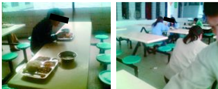
Für 120 Yuan im Monat erhalten die Beschäftigten Essen in der fabriкеigenen Kantine.

Die Angestellten sind mit der Qualität des Essens und der Unterkünfte zufrieden. Den Preis von 120 Yuan im Monat für das Essen finden sie jedoch zu hoch. Zu diesem Preis bietet die fabriкеigene Kantine nur zwei Mahlzeiten am Tag. Arbeiterinnen und Arbeiter, die es vorziehen, außerhalb der Fabrik zu essen, müssen das Essensgeld nicht bezahlen. Das Essen außerhalb der Fabrik ist jedoch teurer.