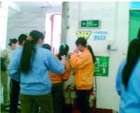
Die Zahl der Feuerlöscher in den Fabrikgebäuden ist sehr gering.

In diesen Nähereien gibt es Stapel von brennbaren Stoffen, die vorhandenen Feuerlöscher sind jedoch nicht ausreichend. Die Beschäftigten haben nie an einer Feuerschutzübung teilgenommen und ein Feuer in einer der Werkstätten könnte verheerende Folgen haben, teilte man Play Fair mit.