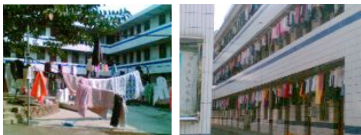
Ein dreistöckiges Wohnheim für die Beschäftigten

Die Angestellten sind mit der Qualität des Essens und der Unterkünfte zufrieden. Den Preis von 120 Yuan im Monat für das Essen finden sie jedoch zu hoch. Zu diesem Preis bietet die fabriкеigene Kantine nur zwei Mahlzeiten am Tag. Arbeiterinnen und Arbeiter, die es vorziehen, außerhalb der Fabrik zu essen, müssen das Essensgeld nicht bezahlen. Das Essen außerhalb der Fabrik ist jedoch teurer.