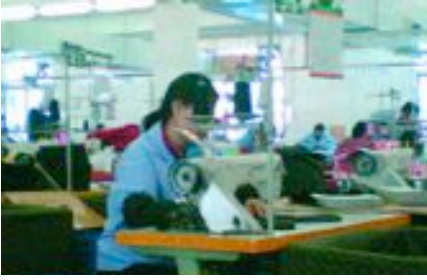
Beim Nähen sitzen die Beschäftigten den ganzen Tag lang auf einem Hocker (ohne Lehne) (Quelle: Play Fair).

Der Lohn für das Nähen von einem Dutzend Teile liegt zwischen 0,5 und 3 Yuan. Ergonomische Probleme wie schmerzende Rücken und Beine kommen in diesen Werkstätten häufig vor. Die Arbeiterinnen und Arbeiter sitzen die gesamten 13 Stunden ihres Arbeitstages auf einem Hocker (ohne Lehne). Mit dem rechten Fuß kontrollieren sie die Maschine und mit den Händen steuern sie den Nähprozess. Nach 13 Stunden intensiver Arbeit beklagen sich viele der Frauen über Schmerzen im rechten Bein und ein völlig taubes Gesäß.