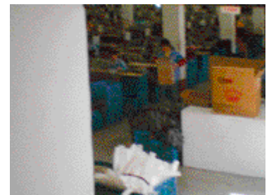
Stapel von brennbaren Stoffen im Fertigungsbereich

In Block B gibt es beispielsweise auf jedem Stockwerk einen Zuschneiderraum. In diesen Räumen werden große Bahnen Stoffe und anderer Textilien zugeschnitten. Die Arbeiterinnen und Arbeiter klagen über den Staub und die Flusen der verschiedenen Materialien, die in diesen Räumen umherfliegen. Die Fabrik stellt keinerlei Schutzausrüstung zur Verfügung. Wenn eine Arbeiterin eine Maske tragen möchte, muss sie sie selber kaufen.